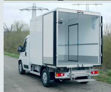
Abbildungen enthalten Sonderausstattungen